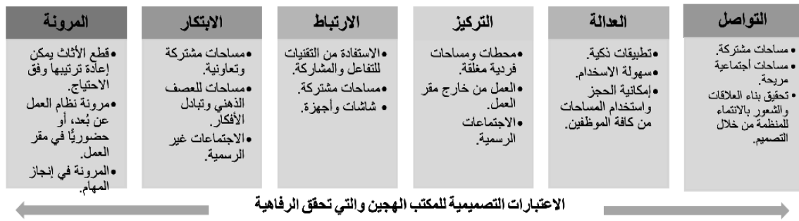
شكل (5) يوضح الاعتبارات التصميمية للمكتب الهجين