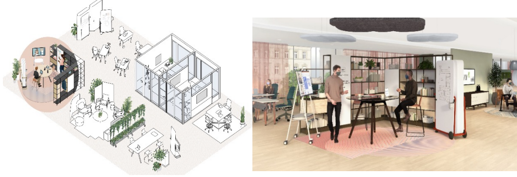
شكل (1) يوضح نموذجًا لتصميم المساحات المشتركة

تصميم مساحات مشتركة مرنة، وجاذبة للموظفين، وتسمح بالمشاركة لتطوير أداء المهام، وتبادل الخبرات.