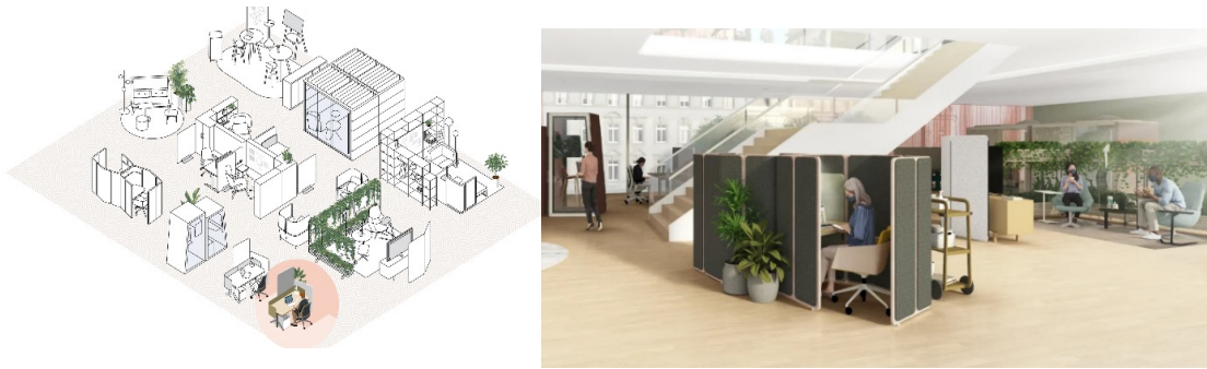
شكل (2) يوضح نموذجًا لتصميم مساحات العمل الشخصية المفتوحة

- التعاون والمرونة التي يتيحها تصميم المكتب الهجين للموظفين من خلال تصميم بيئة العمل المفتوحة بشكل يسمح بالتعاون بين الموظفين في أداء الأعمال، والمرونة في اختيار مكان العمل دون التقييد بمكان وزمان محدد لأداء مهام العمل كما هو موضح بالشكل (2)، حيث أشارت دراسة (Steelcase C(2022) إلى أن 55% من الموظفين فضلوا أن يعملوا يومين في الأسبوع عن بُعد، وباقي أيام العمل في المكتب، وذلك بهدف تحقيق الخصوصية والراحة.