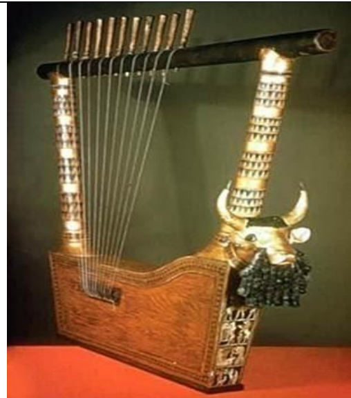
(شكل: 10) قيثارة سومرية