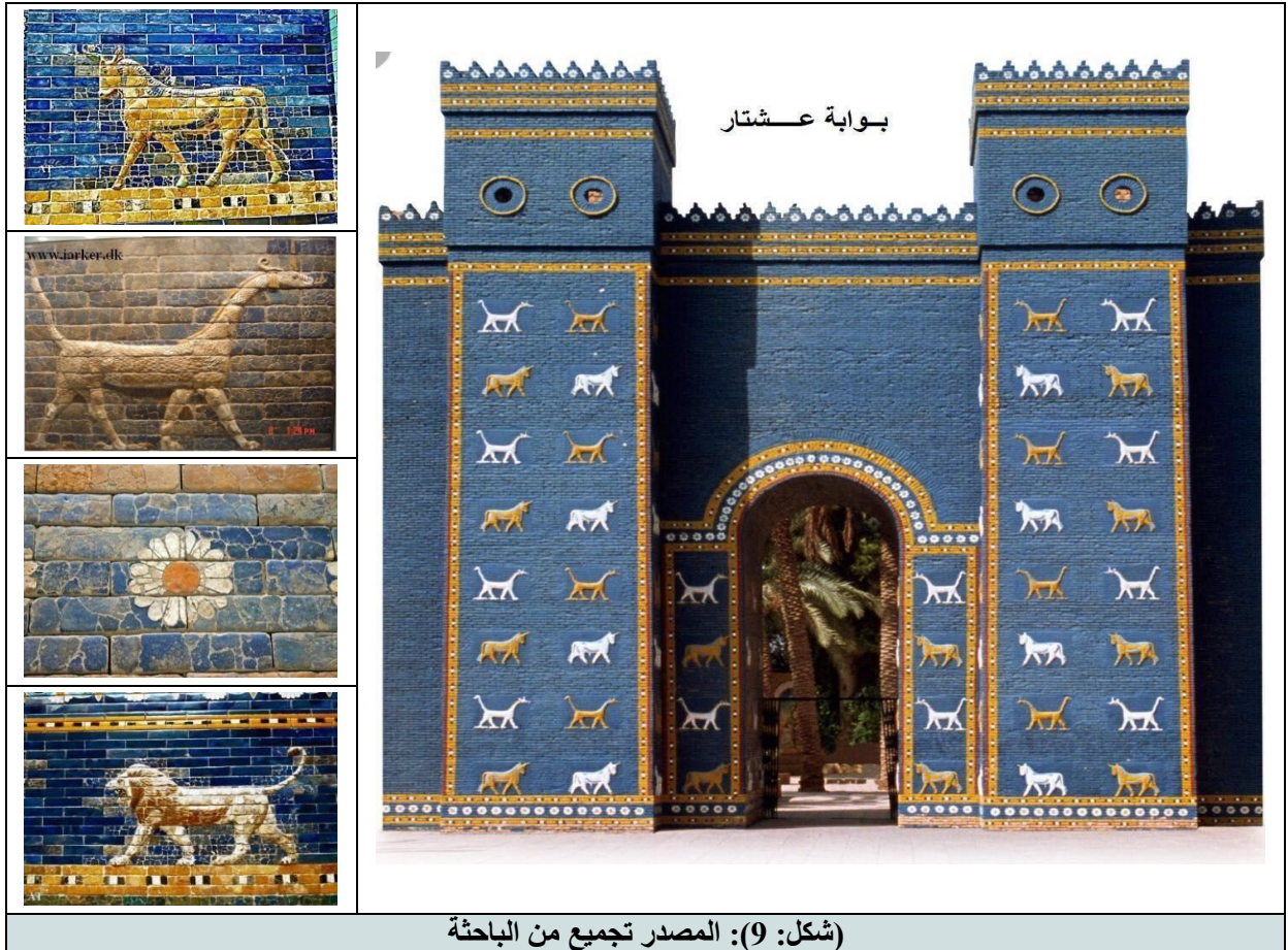
(شكل: 9): المصدر تجميع من الباحثة

1- بوابة عشتار: توصف بأنها من الرموز السومرية المهمة التي تشمل العديد من الترميزات السومرية ومنها زهرة البابونج والتي تمثل رمز الربيع وعلامة الانتصار على الأعداء التي تزين بوابة عشتار وهي رمز سومري واضح يظهر دومًا في المنحوتات السومرية، ويبلغ ارتفاع البوابة مع أبراجها حوالي 50 مترًا، وعرضها 8 أمتار، أما البرجان البارزان على جانبي المدخل فعرض كل منهما حوالي 14 مترًا، وهي مكسوة بكاملها بالمرمر الأزرق والرخام الأبيض والقرميد الملون، ومزينة بأشكال من الحيوانات المألوفة وحيوانات أشكالها من الخيال، وأبوابها مغطاة بالنحاس ومثبت عليها مغاليق ومفاصل من البرونز؛ وكما موضح في الأشكال أدناه.