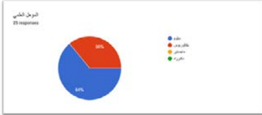
شكل (3): النسبة المئوية لمتغير المؤهل العلمي (تحليل الباحثة)

يوضح الشكل (2) النسبة المئوية لمتغير العمر، فإن أعلى نسبة (64%) في الفئة العمرية من (18) عامًا إلى أقل من (24) عامًا، وتليها نسبة (20%) في الفئة العمرية من (35) عامًا إلى أقل من (44) عامًا، وأقل نسبة (8%) من اللاتي تتراوح أعمارهن بين (25) عامًا، و(34) عامًا.