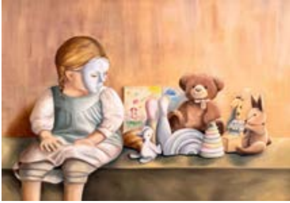
غدي فهد المحمود الأم البيجية زيت على كأنفس 100*80 cm

مع معطيات العصر الحديث ازاد الاهتمام بديكور المنزل المحايد مركزاً على اللون البيج لخلق بيئة هادئة بعيداً عن صخب الحياة وقد امتد هذا الاتجاه إلى ألعاب الأطفال مما أدى إلى تجاهل أهمية التنوع اللوني الذي يساعد في تطوير قدراتهم الإدراكية والحسية وتعزيز نموهم العقلي. هذه دعوة لكسر الروتين وتوفير بيئة مليئة بالتنوع اللوني، ليس فقط للجمال، ولكن لدعم نمو أطفالهم. يخلق المشهد طفلة تشعر بخيبة أمل من ألعابها ذات الألوان المحدودة التي كان من المفترض أن تجلب لها البهجة والفرح لكنها بدلاً من ذلك قيدت عالمها بلون منطقي مما أطفأ شغفها وحيويتها وأثر سلباً على ادراكها