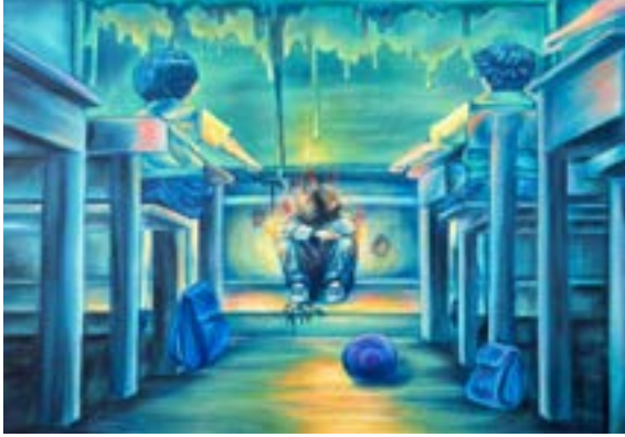
ريما صالح السرحان قد ذاب زيت على كأنفس 100*80

يعكس هذا العمل الفني ظاهرة التنمر وهو أحد أشكال العنف الذي يمارسه طفل أو مجموعه من الأطفال ضد طفل آخر وإزعاجه بطريقة متعمده، ومتكررة، قد يأخذ التنمر اشكالا متعددة كنشر الإشاعات، أو التهديد، أو مهاجمة الطفل بدنيا، أو لفظيا، أو عزله بقصد الايذاء.