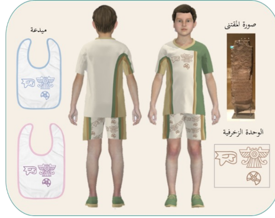
شكل (10): تصميم مجموعة تذكارات ملبسية بزخرفة مستوحاة من مقتنى مسلة من الحجر

يبين الشكل (10) أعلى اليمين صورة لمقتنى مسلة من حجر، وهو مقتنى مستطيل الشكل يحتوي على رموز دينية وكتابة آرامية ذات نحت بارز، ويحتوي على عدد من الرموز المقدسة التي تمتد من القمة إلى الأسفل بمسافة 25 سم يعود تاريخها إلى 539 – 555 قبل الميلاد. وأسفل الصورة رسم للوحدات الزخرفية المقتبسة من زخرفة المقتنى مصفرة، كما يوضح الشكل تصميم مجموعة التذكارات الملبسية مزخرفة بأسلوب الوحدات الزخرفية المفردة مكونة من قميص، وبنطلون، وميدعة للأطفال، منفذة على قماش قطن 100%.