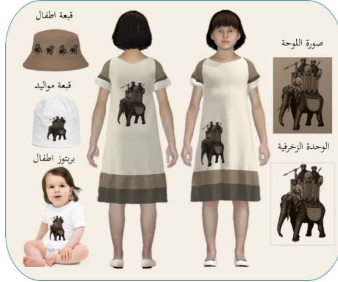
شكل (9): تصميم مجموعة تذكارات ملبسية بزخرفة مقتبسة من مقتنى لوحة عام الفيل

يُظهر الشكل (9) أعلى اليمين صورة لمقتنى لوحة عام الفيل، واللوحة توضح أن نصارى الحبشة بقيادة أبرهة الحبشي قاموا بغزو اليمن، وأسسوا عاصمة لهم في صنعاء، وفي عام 571 ميلادية اتجه أبرهة إلى شمال الجزيرة قاصداً مكة، لهدم الكعبة، واستخدم الفيل الذي لم يكن معروفاً في الجزيرة في ذلك الحين. وأسفل الصورة رسم مصغر للوحة كوحدة زخرفية مفردة، كما يوضح الشكل تصميم مجموعة التذكارات الملبسية مكونة من فستان طفلة، وبربتوز، وقبعة أطفال، وقبعة مواليد منفذة على قماش قطن 100% ومزخرفة بوحدة زخرفية مفردة بأسلوب الطباعة.