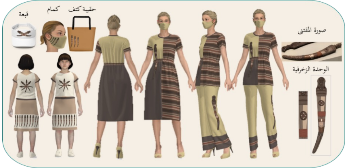
شكل (6): تصميم مجموعة تذكارات ملبسية بزخرفة مقتبسة من مقتنى جنبية معيرة

يوضح الشكل (6) أعلى اليمين صورة لمقتنى جنبية معيرة وزنها 776 جرامًا، المقتنى عبارة عن سلاح يدوي يستخدم للدفاع عن النفس مصنوع من الحديد، وغمد من الخشب الملبس بفضة مزخرفة بزخارف هندسية، رُضع منتصفه بفص أحمر، وعلى المقبض ثلاثة بروزات، وأسفل الصورة رسم الجنبية كاملة كوحدة زخرفية، وأيضًا رسم مصغر لزخرفة الجنبية كوحدة زخرفية، كما يوضح الشكل تصميم مجموعة التذكارات الملبسية مكونة من بلوزة وبنطلون وفستان نسائي، وقميص وجونلة طفلة من قماش مخلوط: قطن 65%، وبوليستر 35%، كما تشمل المجموعة حقيبة كتف، وكمامة، وقبعة من قماش مقاوم للماء، استُخدم في زخرفة المجموعة أسلوب تكرر الوحدة الزخرفية المنتظم، بشكل خطي مستمر، والزخرفة منفذة بأسلوب الطباعة.