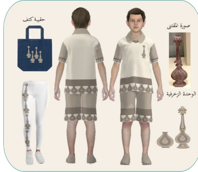
شكل (11): تصميم مجموعة تذكارات ملبسية بزخرفة مقتبسة من مقتنى مرش العطر

يوضح الشكل (11) أعلى اليمين صورة لمقتنى مرش العطر مصنوع من الفضة، منقوش ومزخرف، وجزء من الدبايس العلوية والسفلية مقطوع، وأسفل الصورة رسم الوحدة الزخرفية للمقتنى مصفراً، وأيضاً للجزء السفلي منه، كما يوضح الشكل تصميم مجموعة التذكارات الملبسية من زخرفة المقتنى مصفرة مكونة من قميص وبنطلون للأطفال، وبنطلون وحقيبة للنساء، منفذة على قماش قطن 100%، استُخدم أسلوب التكرار المنتظم الأفقي على أطراف قميص وبنطلون الطفل، والتكرار المنتظم الرأسى على البنطلون النسائي، والتكرار المتبادل على الحقيبة، والوحدة الزخرفية مفردة على قميص الطفل. وتنفذ الزخارف بالطباعة.