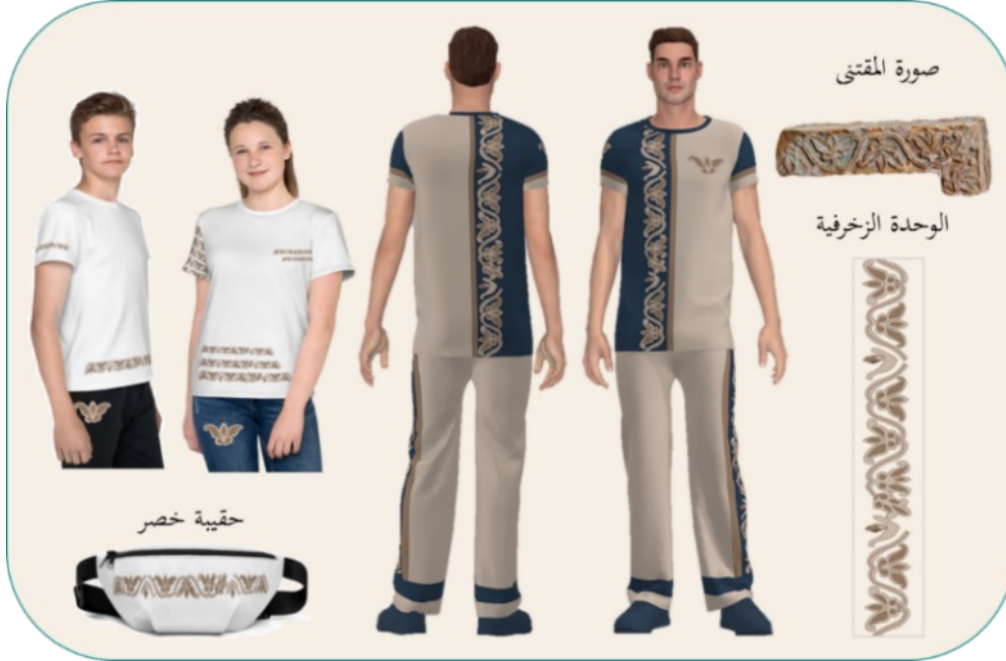
شكل (4): تصميم مجموعة تذكارات ملبسية بزخرفة مستوحاة من مقتنى جزء من شريط زخرفي رخامي

يظهر الشكل (4) أعلى اليمين صورة مقتنى جزء من شريط زخرفي رخامي، وهو عبارة عن جزء من شريط زخرفي عليه زخرفة نباتية مصنوع من حجر الرخام، وأسفل الصورة رسم الوحدة الزخرفية للمقتنى مصفرة. كما يوضح الشكل تصميم مجموعة تذكارات ملبسية مكونة من قميصين رجاليين وقميص نسائي، وبنطلونين رجاليين وبنطلون نسائي، يستخدم في تنفيذها قماش مخلوط: قطن 65%، وبوليستر 35%. كما شملت المجموعة حقيبة خصر من قماش مقاوم للماء، وجميع قطع المجموعة مزخرفة بوحدة زخرفية مستوحاة من مقتنى جزء من شريط زخرفي بأسلوب التكرار المنتظم، ويُستخدم في تنفيذ زخرفة المجموعة الملبسية التطريز الآلي.