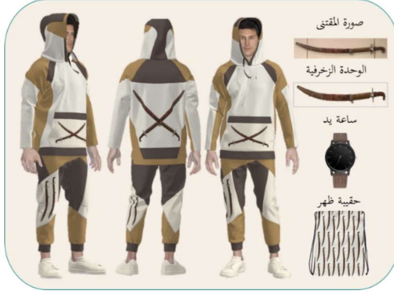
شكل (2): تصميم مجموعة تذكارات ملبسية بزخرفة مقتبسة من مقتنى السيف

يوضح الشكل (2) أعلى اليمين صورة لمقتنى السيف، وهو مقتنى يُستخدم للحرب يعود تاريخه إلى فترة ما قبل الميلاد، مصنوع من المعدن والخشب، وله جراب من الوسط مكفت بالجلد وبه حلقة للتعليق. وأسفل الصورة رسم الوحدة الزخرفية للمقتنى مصفرة، كما يوضح الشكل تصميم مجموعة تذكارات ملبسية مكونة من بلوزة بقبعة وبنطلون من قماش مخلوط: قطن 65%، وبوليستر 35%، كما تشمل المجموعة ساعة وحقيبة ظهر من قماش مقاوم للماء مزخرفة بأسلوب الطباعة بزخارف مقتبسة من المقتنى، وقد استُخدم في الزخرفة أسلوب التكرار المتقاطع في البلوزة، والتكرار المنتظم في البنطلون، والتكرار المتبادل في الحقيبة، والوحدة الزخرفية المفردة في سير الساعة.