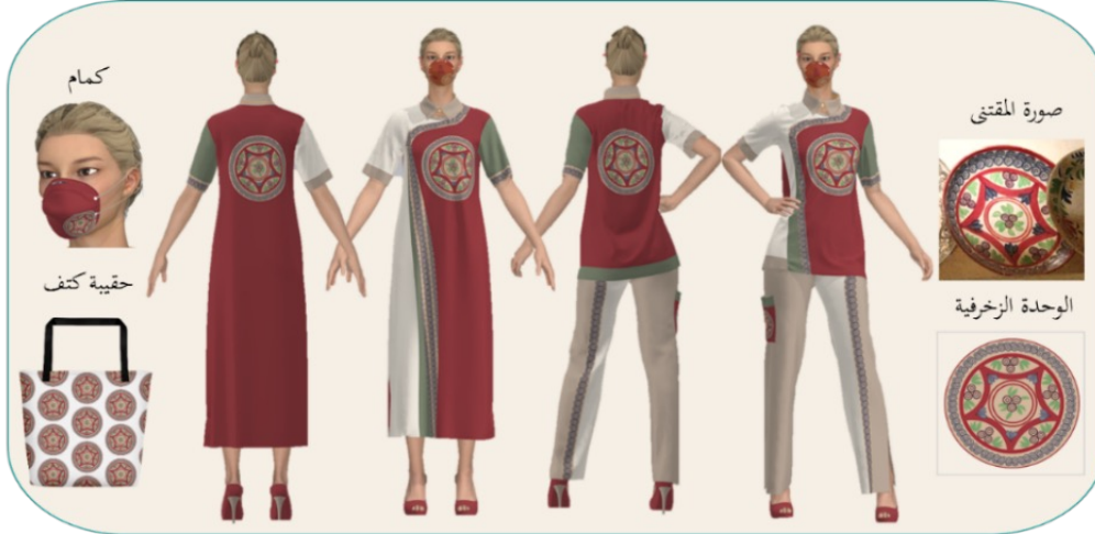
شكل (8): تصميم مجموعة تذكارات ملبسية بزخرفة مقتبسة من مقتنى صحن خزف

يُظهر الشكل (8) أعلى اليمين صورة لمقتنى صحن من الخزف، وهو عبارة عن صحن يُستخدم لتقديم الطعام، متوسط الحجم يزن 965 جرامًا من الخزف مزجج عليه زخارف نباتية وهندسية من الداخل باللونين الأزرق والأحمر. وأسفل الصورة رسم الوحدة الزخرفية المقتبسة من الصحن مصفرة، كما يوضح الشكل تصميم مجموعة التذكارات الملبسية مكونة من بلوزة وبنطلون وفستان من قماش مخلوط: قطن 65%، وبوليستر 35%، كما تشمل المجموعة كمامة وحقيرة كتف من قماش مقاوم للماء مزخرفة، استُخدم لتنفيذ الوحدة الزخرفية المفردة أسلوب الطباعة على كامل المجموعة.