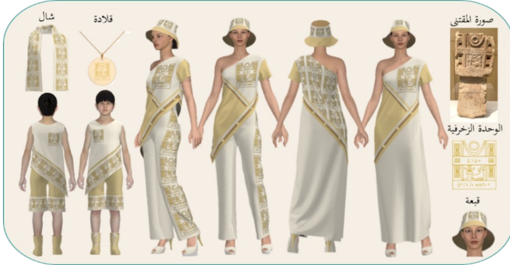
شكل (5): تصميم مجموعة تذكارات ملبسية بزخرفة مقتبسة من مقتنى مبخرة

يُظهر الشكل (5) أعلى اليمين صورة لمقتنى المَبْخَرة، وهو مقتنى مصنوع من الحجر الجيري الصلب يتكون من جزئین: قاعدة ورأس، القاعدة على شكل برج محفور، على واجهته الأمامية نقش من الخط المسند مكون من أربعة أسطر ومقسم بأربعة خطوط أفقية وستة خطوط عمودية، وأسفل الصورة رسم الوحدة الزخرفية لرأس المقتنى مصفرة. كما يوضح الشكل تصميم مجموعة التذكارات الملبسية مزخرفة بالوحدة الزخرفية المقتبسة من زخرفة رأس مقتنى المبخرة بأسلوب التكرار المنتظم. وتتكون المجموعة من بلوزة يمكن تحويلها إلى فستان طويل بإضافة قطعة تثبت في نهاية البلوزة باستخدام الأزرار والعراوي، وبنطلون نسائي، بالإضافة إلى بلوزة وبنطلون للأطفال، يُستخدم في تنفيذ المجموعة قماش مخلوط: قطن 65%، وبولايستر 35%، كما شملت المجموعة قلادة معدنية مزخرفة بالوحدة الزخرفية منفردة، وشال وقبعة، يُستخدم في تنفيذ الزخرفة التطريز الآلي.