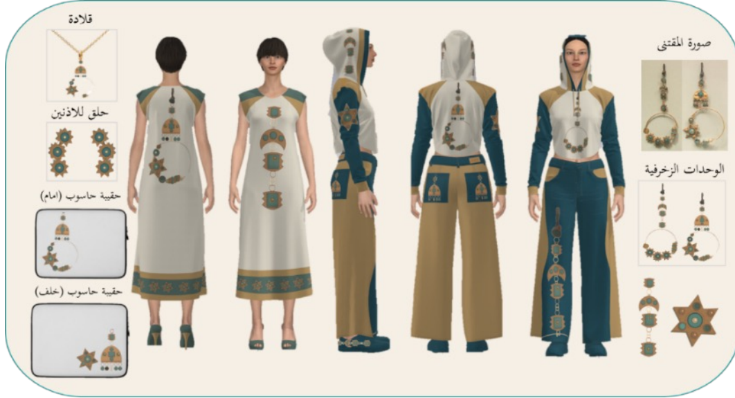
شكل (7): تصميم مجموعة تذكارات ملبسية بزخرفة مقتبسة من مقتنى الزمام

يبين الشكل (7) أعلى اليمين صورة لمقتنى الزمام، وهو مقتنى من أنواع حلي الرأس، يستخدم زينة للأنف، وهو عبارة عن حلقة دائرية من الذهب مزينة بنجوم مثبتة فيها، ومرصعة بفصوص من حجر الفيروز وخرز من الذهب واللؤلؤ. وأسفل الصورة رسم الوحدة الزخرفية للمقتنى كاملاً بالدجم الطبيعي، كما استُخدم أسلوب التجزئة للوحدة الزخرفية مكبرة. ويوضح الشكل تصميم مجموعة التذكارات الملبسية مكونة من بلوزة متصلة بقبعة وينطلون وفتان من قماش مخلوط: قطن 65%، وبوليستر 35%، كما شملت المجموعة قلادة وحلقاً للأذنين من المعدن مصوغ بالوحدات الزخرفية، وحقيبة حاسوب من قماش مقاوم للماء. استُخدم أسلوب الطباعة في تنفيذ الوحدات الزخرفية المفردة والمكررة.