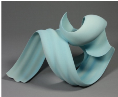
شكل (2) خزف أزرق فاتح