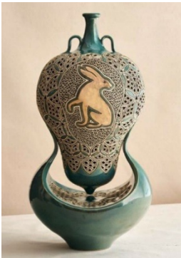
شكل (1) المزهرية العائمة 6 - إبراهيم سعيد