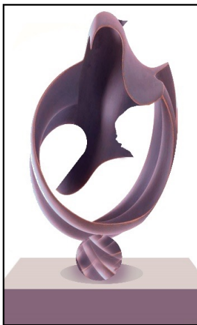
شكل (5) أمومة مقابل سلام - الباحثة

ومربية، لتوجيه جيل الشباب للطريق الصحيح.