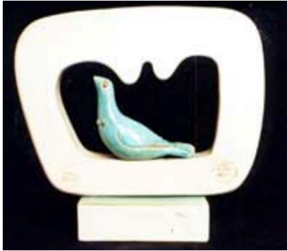
شكل (3) حمامة السلام

( https://www.tastecontemporary.com/wouter-dam )