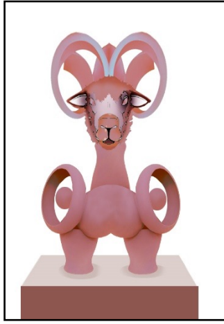
شكل (6) عيون لا تنام - الباحثة

عبر الشكل عن الأمومة عند الحيوان، حيث تم صياغة الجزء السفلي من الكبش على هيئة جسد طفل صغير، وعلى يمينه ويساره دائرتان عبر الفراغ بداخلهما عن شكل العين الحارسة للطفل، تعبيرًا عن حرص أنثى الخروف على ابنها مثل الأم في عالم الإنسانية، ولتأكيد الحماية يعلو وجه أنثى الخروف قرون تأخذ تارة شكل المظلة، وتارة أخرى شكل زهرة اللوتس، تعبيرًا عن امتداد دور الأم منذ زمن المصري القديم.