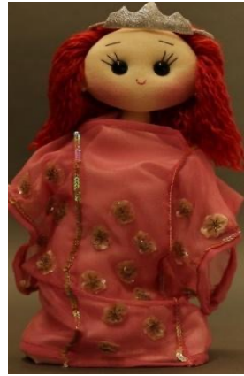
شكل (3): ثوب الزبون «يمثل في المسرحية فستان زواج الجدة»

ويوضح الشكل رقم (2) مشهد من المسرحية لشخصية الجدة وهي تروي للحفيدة تراث أهل الحجاز، كما توضح الديكور والخلفية التي اتسمت بالطابع التراثي، لإضفاء روح المعيشة وجذب انتباه الأطفال.