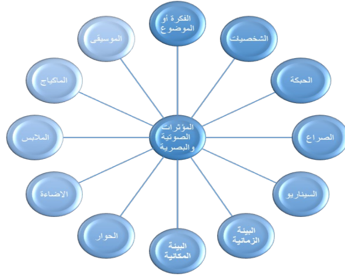
شكل (1): عناصر بناء المسرحية (تصميم الباحثات)