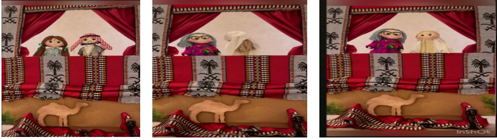
شكل (2) توضح مجموعة من مشاهد مسرحية (أرض الحجاز)

ويوضح الشكل رقم (2) مشهد من المسرحية لشخصية الجدة وهي تروي للحفيدة تراث أهل الحجاز، كما توضح الديكور والخلفية التي اتسمت بالطابع التراثي، لإضفاء روح المعيشة وجذب انتباه الأطفال.