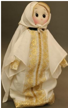
شكل (5): ثوب درفة الباب وغطاء الرأس المحرمة والمحدورة يمثل أحد فساتين الجدة في مرحلة الشباب