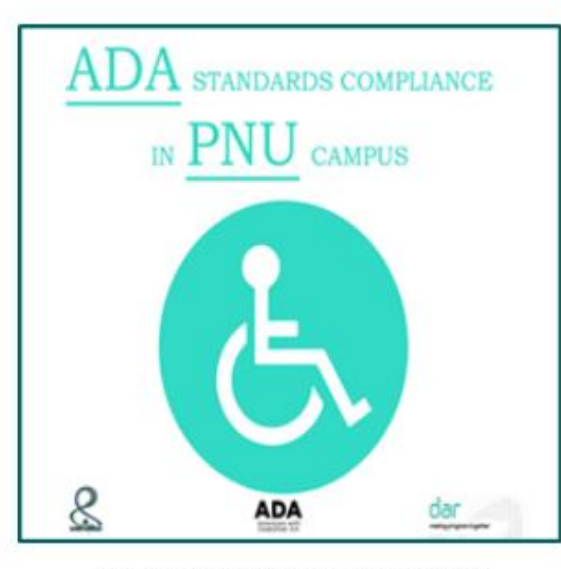
ADA STANDARDS COMPLIANCE IN PNU CAMPUS

A detailed display facility for available services