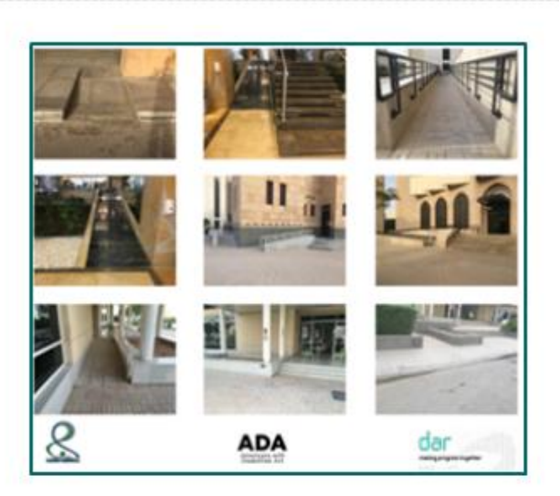
ADA STANDARDS COMPLIANCE IN PNU CAMPUS