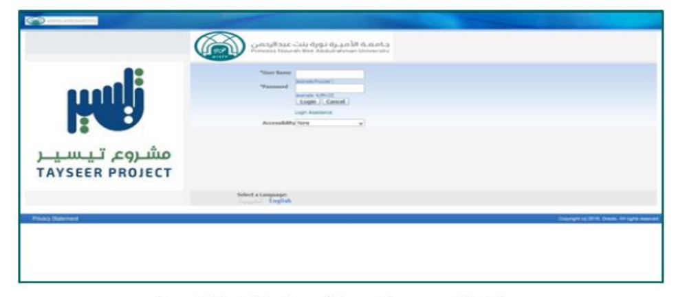
General Administration of Human Resources Plataform

Additionally, complaints or suggestions can be addressed directly to the Secretary of the General Administration of Human Resources or through login in the platform.