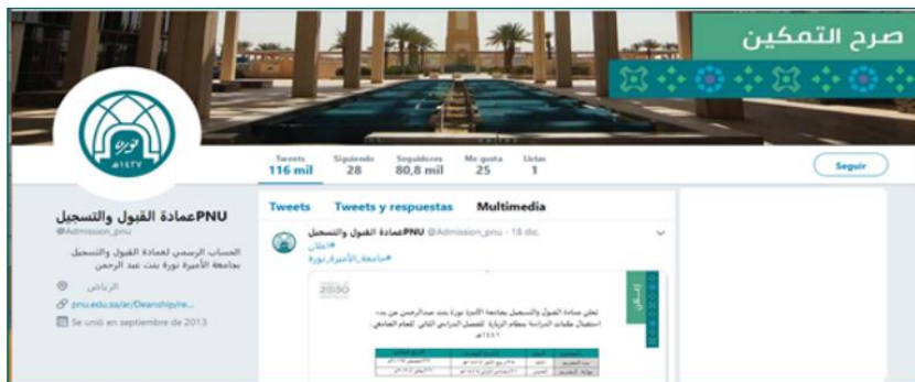
PNU Admission guide